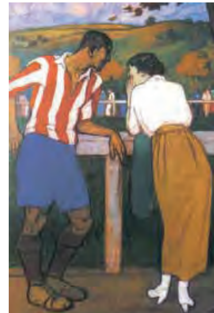
© Aurelio Arteta, "Idilio en los Campos de Sport", VEGAP, Bilbao 2012. Propiedad: Athletic Club. Bilbao

Pichichi, quien fuera símbolo vivo de toda una generación, ha dado su nombre al trofeo que se entrega cada año al máximo goleador de la Liga Española de Fútbol.