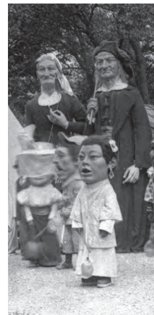
© Ricardo Longa. Euskal Museoa Bilbao Museo Vasco.

La pareja de Aldeanos aparece, por primera vez, en la generación de Gigantes de 1896, vestidos con los trajes tradicionales del Valle de Arratia. Representan el mundo rural bizkaino, muy presente en la vida social y festiva de la Villa, a finales del siglo XIX.