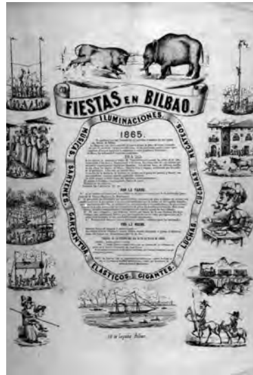
Nº inventario 90/2886