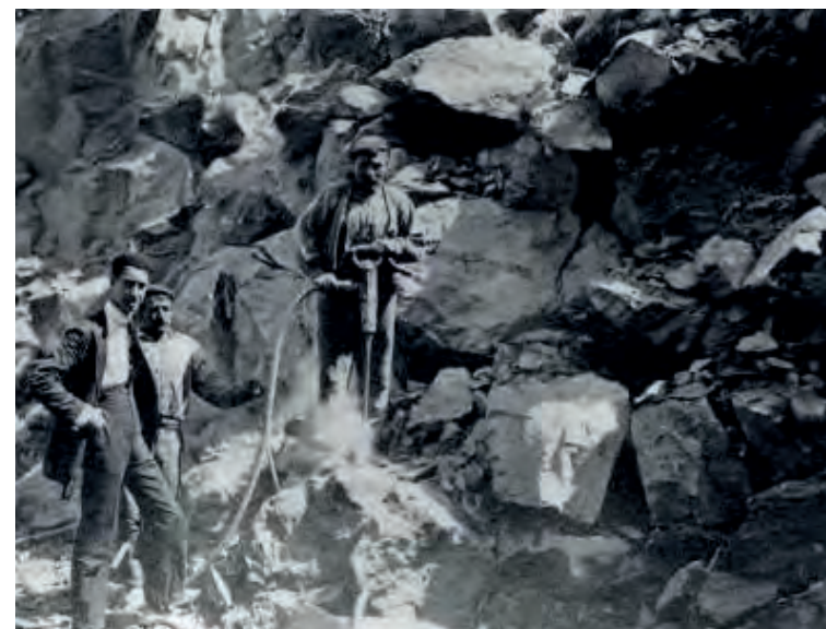
© Euskal Herriko Meatzagintza Museoa Museo de la Minería del País Vasco. Gallarta (Bizkaia)