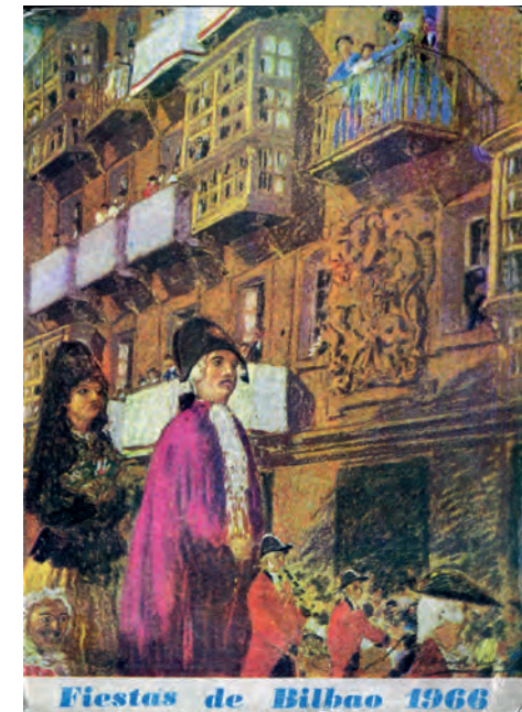
© Euskal Museoa Bilbao Museo Vasco Nº inventario 90/3042

En 2015 el vestuario de Doña Tomasa fue renovado por Beatriz Valdivielso.